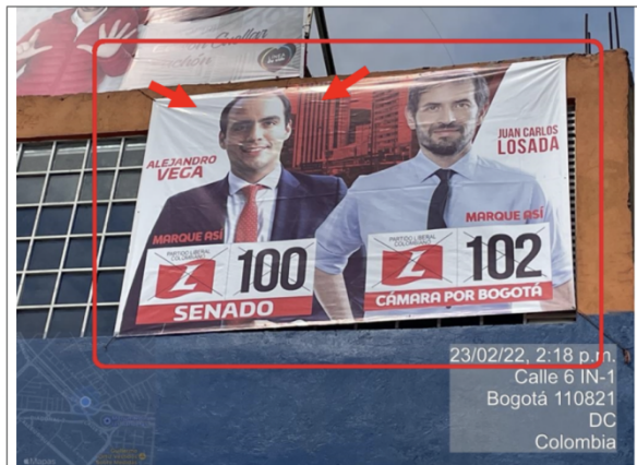
Foto No. 3 Se evidencia un elemento tipo aviso en fachada ubicado en la parte superior del predio el cual se encuentra incorporado en la ventana de la edificación, con texto publicitario: "ALEJANDRO VEGA + IMAGEN + MARQUE ASÍ + PARTIDO LIBERAL COLOMBIANO + LOGO PARTIDO LIBERAL + 100 + SENADO (...)".