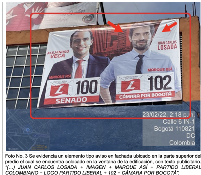
Foto No. 3 Se evidencia un elemento tipo aviso en fachada ubicado en la parte superior del predio el cual se encuentra colocado en la ventana de la edificación, con texto publicitario: "(...) JUAN CARLOS LOSADA + IMAGEN + MARQUE ASÍ + PARTIDO LIBERAL COLOMBIANO + LOGO PARTIDO LIBERAL + 102 + CÁMARA POR BOGOTÁ".