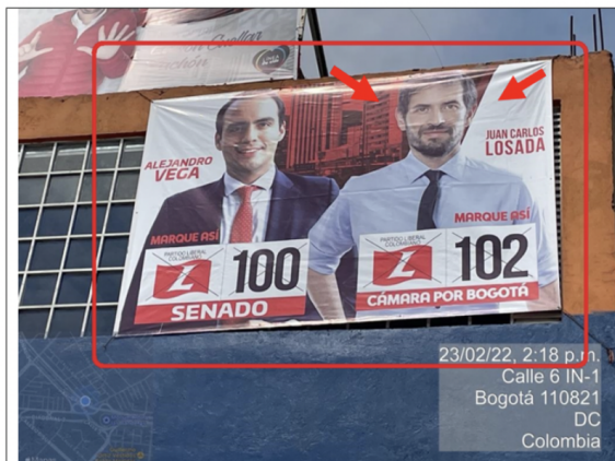
Foto No. 3 Se evidencia un elemento tipo aviso en fachada ubicado en la parte superior del predio el cual se encuentra colocado en la ventana de la edificación, con texto publicitario: "(...) JUAN CARLOS LOSADA + IMAGEN + MARQUE ASÍ + PARTIDO LIBERAL COLOMBIANO + LOGO PARTIDO LIBERAL + 102 + CÁMARA POR BOGOTÁ".

Fuente: Concepto Técnico 3319 del 29 de marzo de 2022.