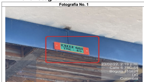
Foto No. 1 Nomenclatura urbana del predio donde se encuentra instalado el elemento tipo aviso en fachada del candidato a la cámara por Bogotá JUAN CARLOS LOZADA VARGAS del partido político Partido Liberal Colombiano , el cual se ubica en la dirección Calle 6 No. 78 C – 45